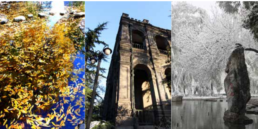
ACADEMIC GUIDEBOOK FOR UNDERGRADUATES 2015 RENMIN UNIVERSITY OF CHINA