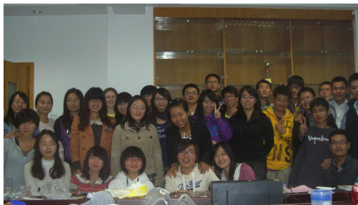
图为2011级三四班同学合影

“此次聚会也许是我们分班以前的最后一次聚会。可是我们三四班的情谊却永远不会断。我们都会珍惜彼此在青春里留下的印记,让三四班的感情永远延续下去。”