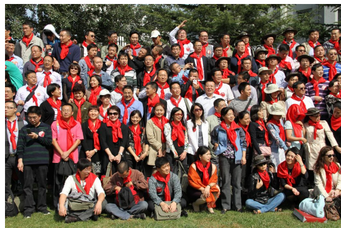
■图为我院88级校友在教二大堂坪合影留念

二十年前,他们在这里别离;二十年后,他们在这里重聚。中国人民大学1988级本科社会学系、人口学系校友,藉中国人民七十五周年校庆,欢聚一