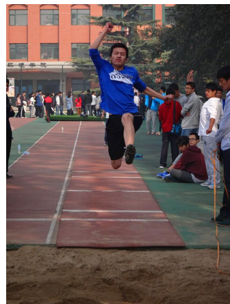
■ 摄影/李斯 熊渝媛