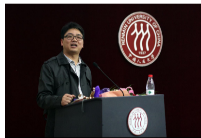
刘强东校友正在演讲