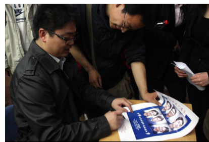
刘强东校友为同学们签名留念