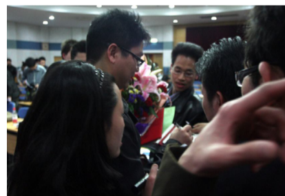
刘强东校友与同学们深入交流