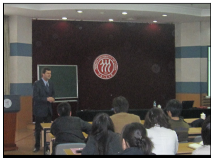
图为 Alain de beuckelaer 教授为我院学子做社会调查研究方法的专题讲座

讲座结束后,Beuckelaer教授对同学们提出的问题 and 困惑给予了详细而热情的解答。同学们纷纷表示,在中国人民大学“十年腾飞”迈向国际化的大背景下,这场关于跨文化调查研究中的等值性与偏差类型的讲座令自己受益匪浅,这将更有助于自己开展社会实践。